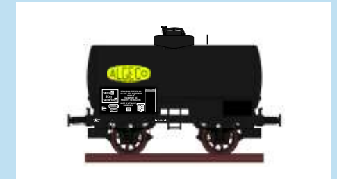
4527 Kesselwagen "ALGECO", SNCF, Ep. III Wagon citerne "ALGECO", SNCF, ép. III