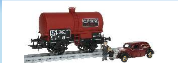
4520 Set: Weinkesselwagen "CFWR", SNCF, Ep. III, mit Lieferwagen Citroen 11CV und Figurine "Weinhändler" Coffret: citerne à vin "CFWR", SNCF, ép. III, avec fourgonette Citroen 11CV et figurine "marchand de vin"

Sondermodell édition spéciale Railexpo 2011