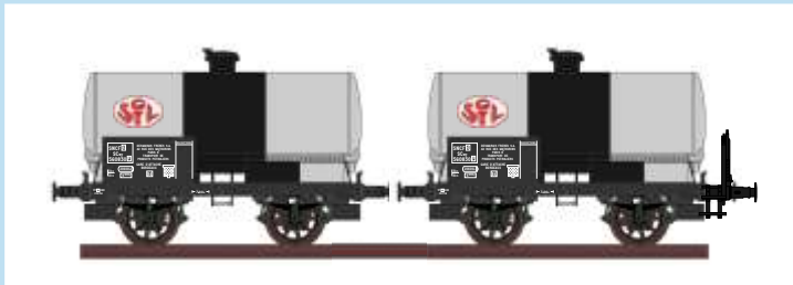
4523 Set mit zwei Weinkesselwagen "SGTL", SNCF, Ep. III Coffret avec deux wagons citerne à vin "SGTL", SNCF, ép. III