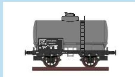
4526 Kesselwagen "neutral", SNCF, Ep. III Wagon citerne "neutre", SNCF, ép. III