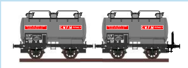
4525 Set mit zwei Weinkesselwagen "CWFM", SNCF, Ep. III Coffret avec deux wagons citerne à vin "CWFM", SNCF, ép. III