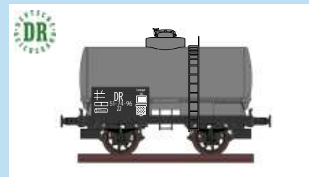
4530 Kesselwagen, DR (DDR), Ep. III Wagon citerne, DR (RDA), ép. III