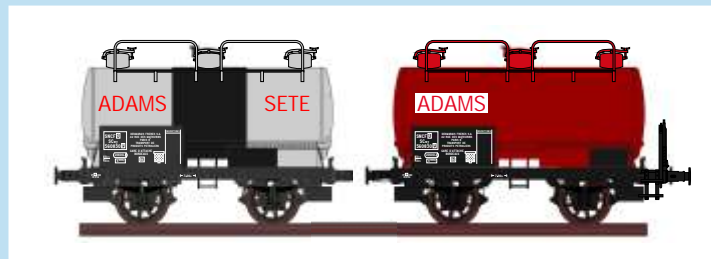
4531 Set mit zwei Weinkesselwagen "ADAMS", SNCF, Ep. III Coffret avec deux wagons citerne à vin "ADAMS", SNCF, ép. III