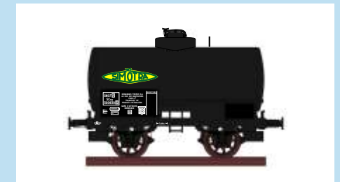
4528 Kesselwagen "SIMOTRA", SNCF, Ep. III Wagon citerne "SIMOTRA", SNCF, ép. III