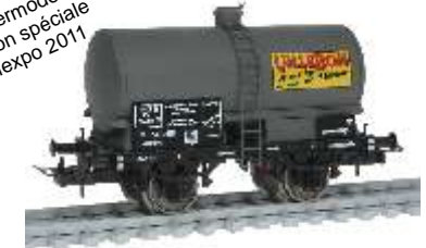
4521 Weinkesselwagen "Villebon", SNCF, Ep. III Citerne à vin "Villebon", SNCF, ép. III

Sondermodell édition spéciale Railexpo 2011