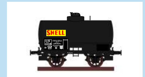
4529 Kesselwagen "SHELL", SNCF, Ep. III Wagon citerne "SHELL", SNCF, ép. III

Technische Daten für alle Modelle dieser Seite: LüP: 80,2mm (ohne Bremserb.), Kurzkupplung, Normkupplungskopf nach NEM, Rahmen aus Zinkdruckguss. Niedrige Spurkränze (0,9mm) nach NEM.